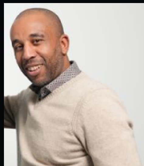
Hakim BENASSOUL Photographe